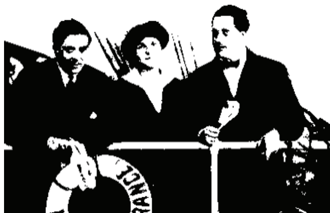
Apollinaire avec des amis sur un bateau.

1903 - 1914 - Apollinaire développe au fur et à mesure des années une correspondance avec des artistes et ses amis. Du pneumatique envoyé par le Douanier Rousseau pour l'inviter à une soirée chez lui, jusqu'aux remerciements d'un peintre pour avoir fait une "bonne critique" dans ses articles de presse. Il n'est pas rare qu'un de ces artistes lui offre une peinture en remerciement. En effet, Apollinaire dans ses textes rend compte de toutes les expositions d'art, peinture, sculpture, beaux arts, et se forge ainsi une réputation européenne. Ainsi il envoie des papiers pour des expositions dans différents pays. Il est à l'écoute des artistes, des marchands d'art et des galeristes. Les hommes politiques de l'époque visitaient également les expositions de peintures.