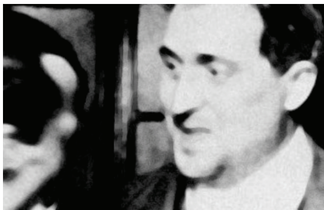
Apollinaire à Paris.

Apollinaire publie d'abord des poésies dans des revues. Il édite également des contes. Il fait fructifier son activité journalistique. Comme critique d'art, d'abord, dont il crée le genre, et aussi comme journaliste couvrant les actualités dans ses Anecdotes .