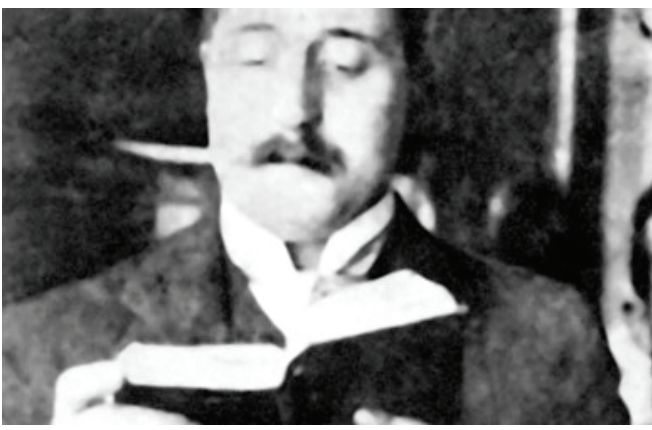
Apollinaire en pleine lecture.