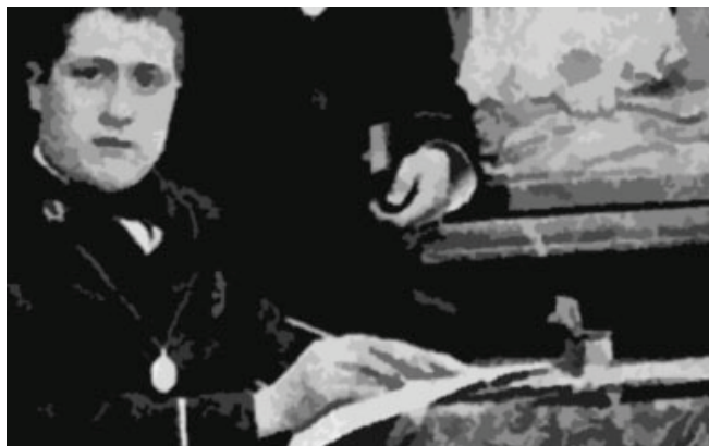
Apollinaire en photo lors de ses études.

1899 - Les Kostrowitzky quittent Monaco pour Aix-les-Bains, puis Lyon et enfin Paris. La mère d'Apollinaire se fait refuser l'entrée de plusieurs casinos. À Lyon, Guillaume fréquente la bibliothèque municipale. En avril la famille se trouve à Paris, mais sans le sou.